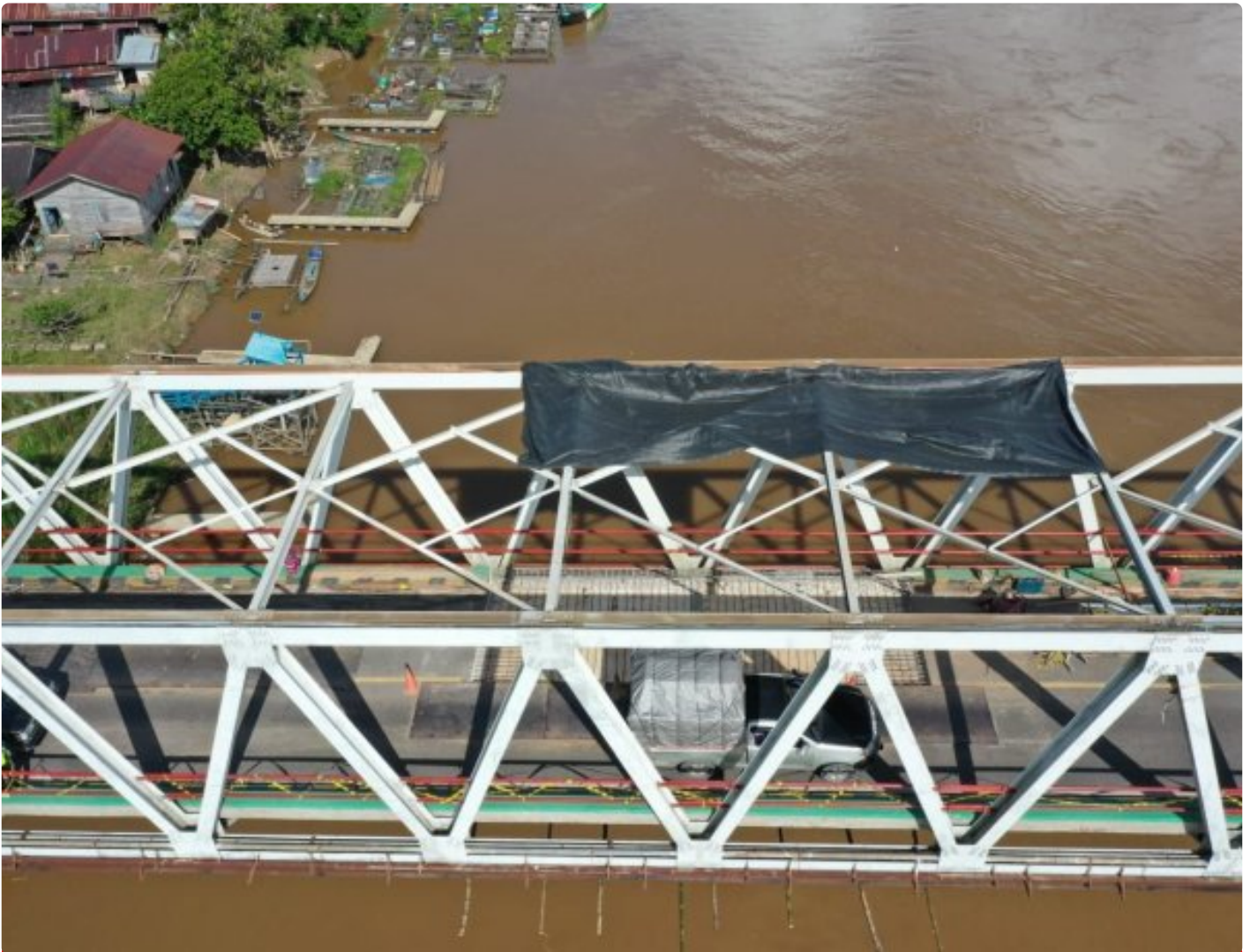
Jembatan Kasongan (Sei Katingan) Dalam Proses Perbaikan Oleh BPJN Kalimantan Tengah

KATINGAN - Penutupan jembatan Sei Katingan atau jembatan Kasongan, Kabupaten Katingan yang direncanakan akan ditutup pada tanggal 27 Maret 2023, akan diundur dua hari yaitu pada tanggal 29 Maret 2023.